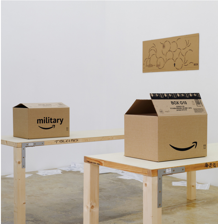
Legend : Vue de l'exposition Francesc Ruiz, Some Street Storyboards, Florence Loewy, Paris