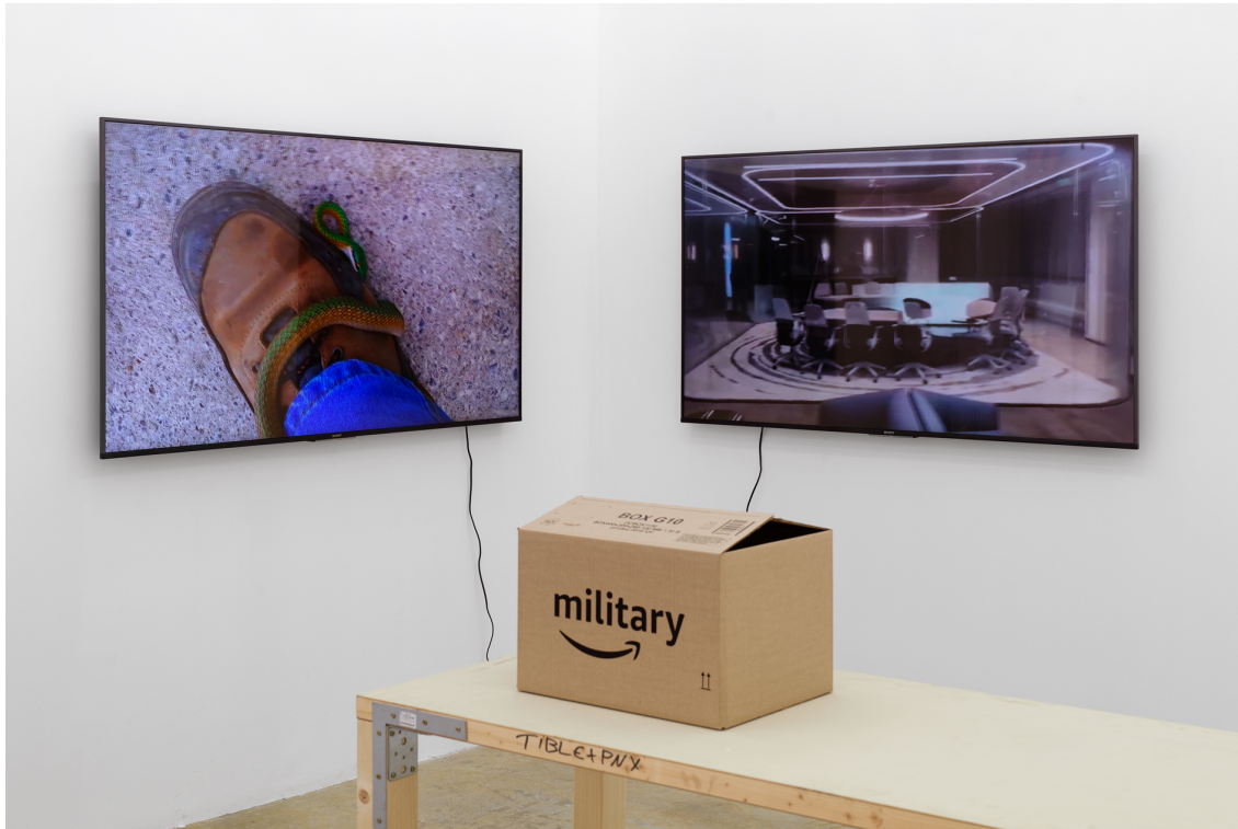
Legend : Francesc Ruiz, It's River, 2019 Vue de l'exposition Francesc Ruiz, Some Street Storyboards, Florence Loewy, Paris