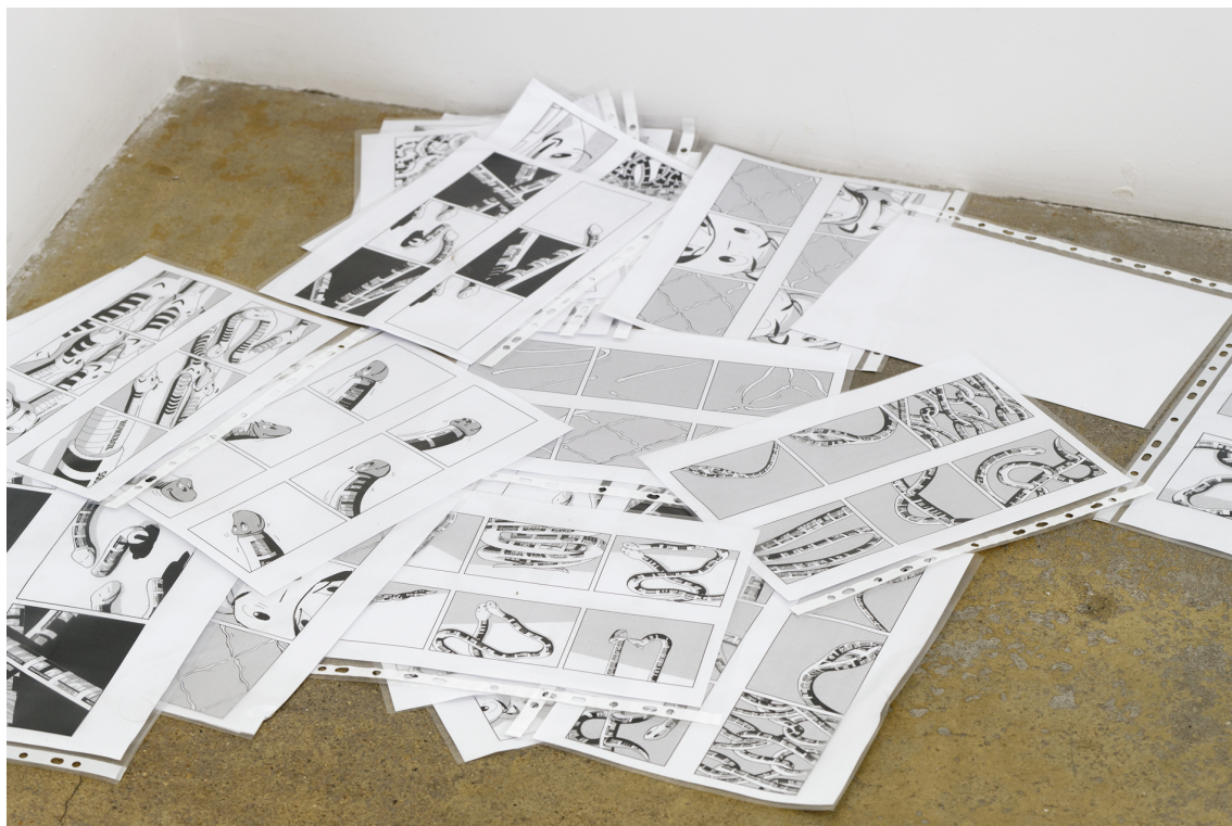
Legend : Vue de l'exposition Francesc Ruiz, Some Street Storyboards, Florence Loewy, Paris