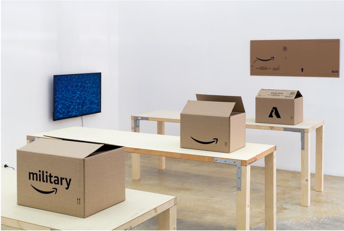
Legend : Vue de l'exposition Francesc Ruiz, Some Street Storyboards, Florence Loewy, Paris