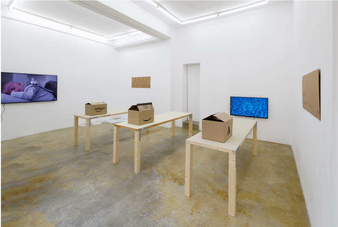
Legend : Vue de l'exposition Francesc Ruiz, Some Street Storyboards, Florence Loewy, Paris