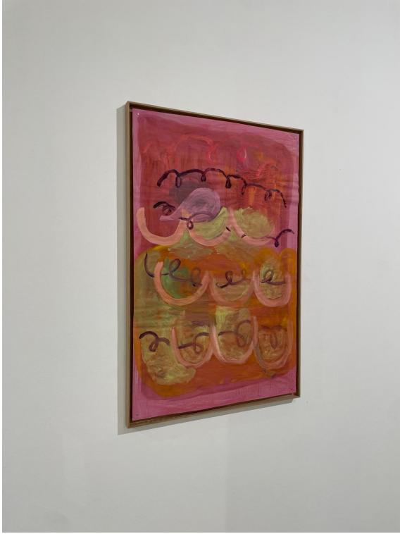
Legend : Romain Bobichon, Pyjama Papers #18, 2024, Galerie Florence Loewy - Paréidolie, salon international du dessin contemporain, Marseille