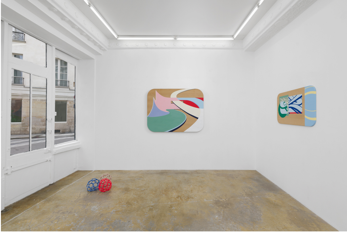
Legend : Vue de l'exposition « Double Respawn », Valentin Guillon, Galerie Florence Loewy, 2024