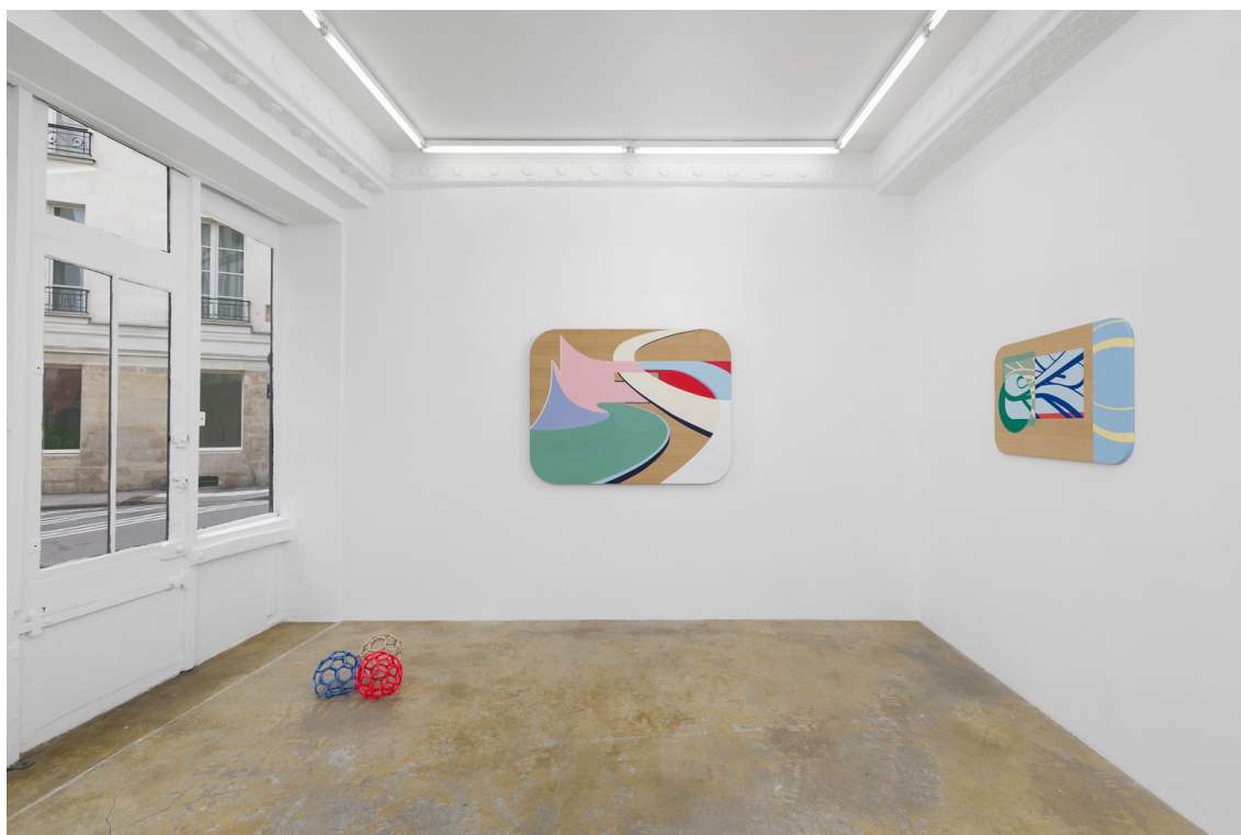
Legend : Vue de l'exposition « Double Respawn », Valentin Guillon, Galerie Florence Loewy, 2024