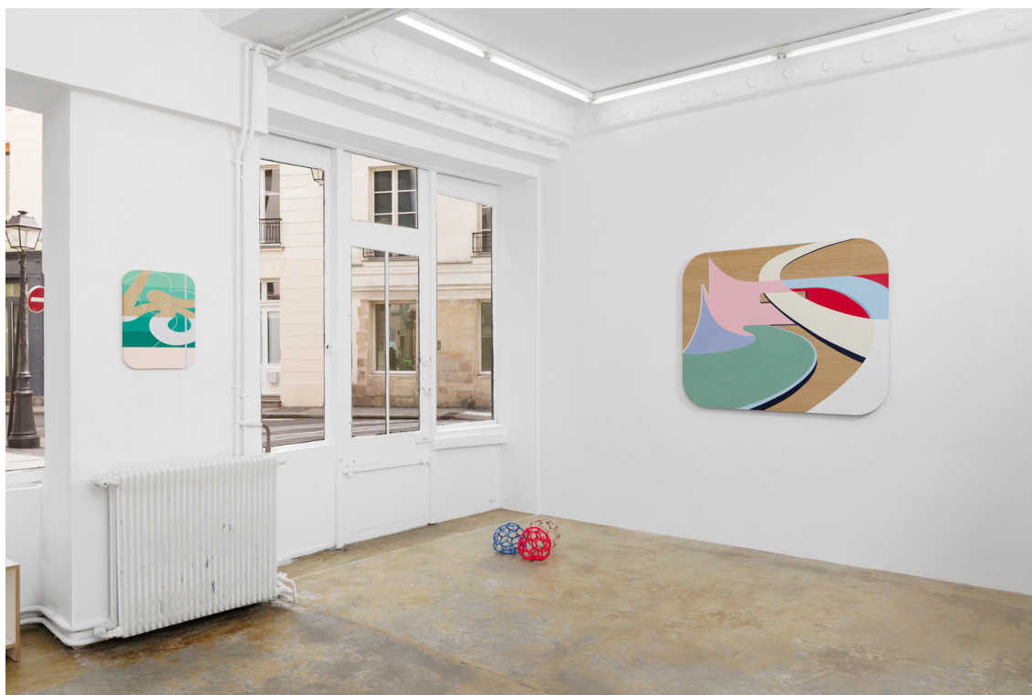
Legend : Vue de l'exposition « Double Respawn », Valentin Guillon, Galerie Florence Loewy, 2024