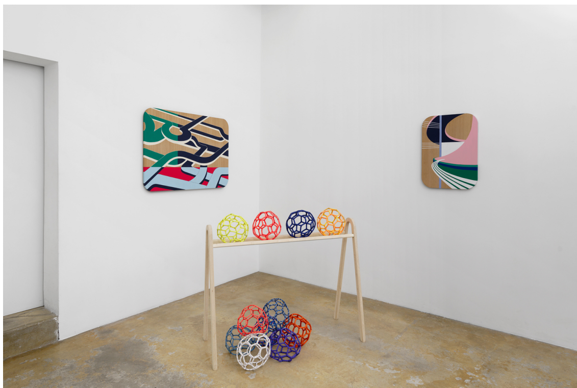
Legend : Vue de l'exposition « Double Respawn », Valentin Guillon, Galerie Florence Loewy, 2024