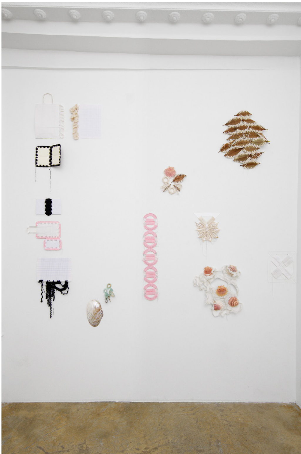
Vue de l'exposition Déborder de ses bords , Silvana Mc Nulty, Galerie Florence Loewy, Paris Réalisée avec le soutien aux galeries / exposition du Centre national des arts plastiques.