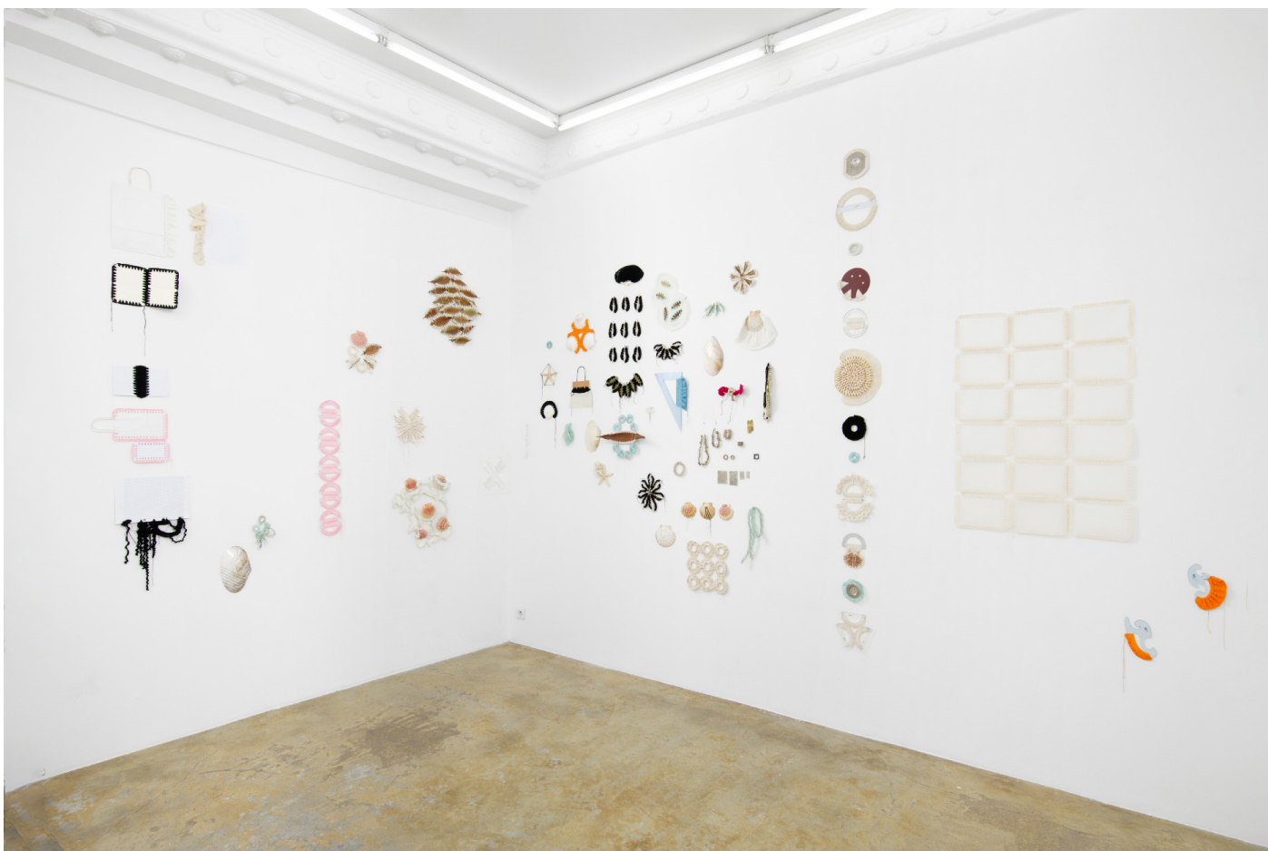
Vue de l'exposition Déborder de ses bords , Silvana Mc Nulty, Galerie Florence Loewy, Paris

du 9 septembre au 11 novembre 2023 Exposition personnelle de Silvana Mc Nulty. Assistée par Lucy Gloria Da Silva. Réalisée avec le soutien aux galeries / exposition du Centre national des arts plastiques.