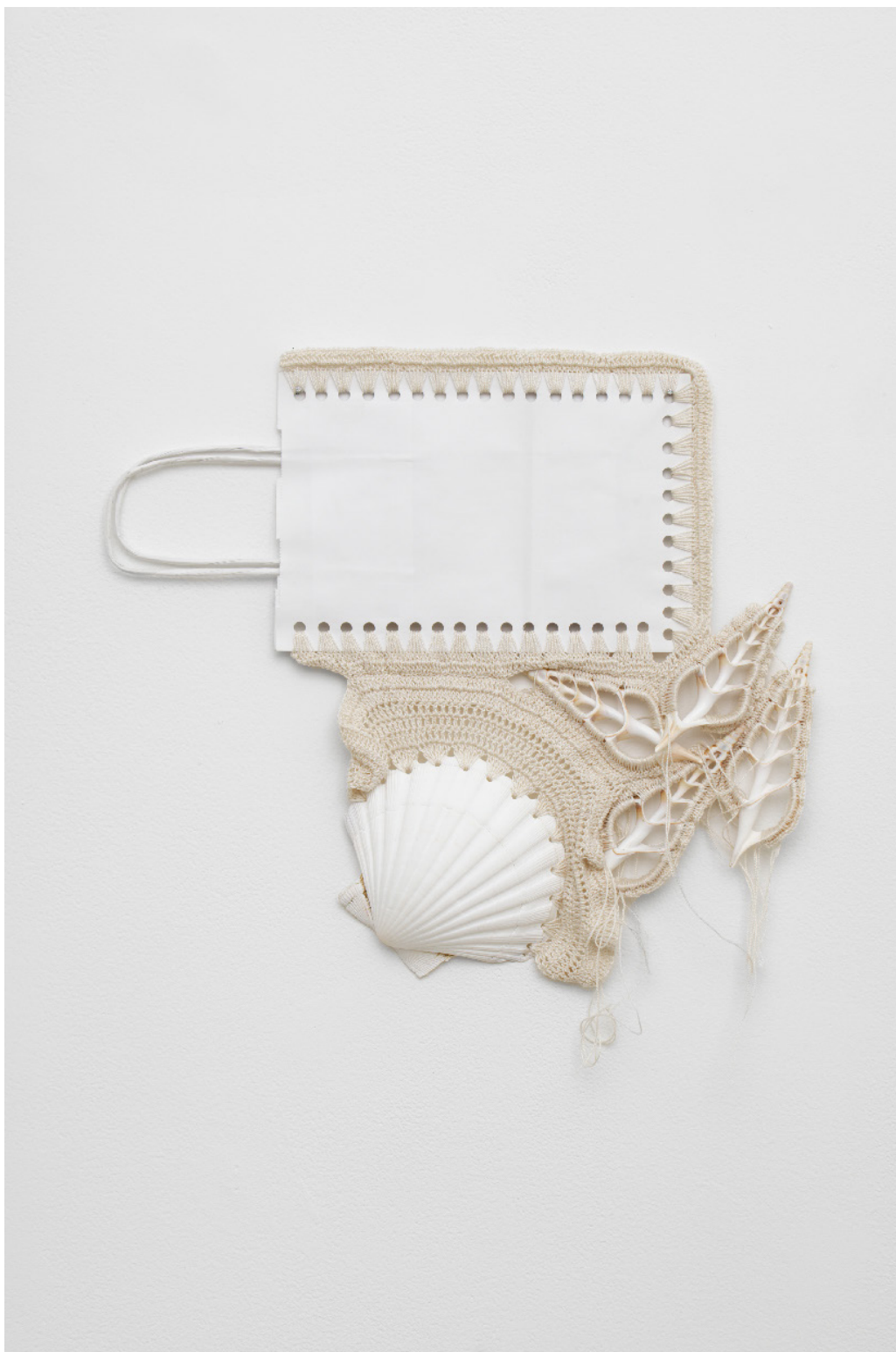
Silvana Mc Nulty, Sac, coquillage et tranches de coquillages crochetés blanc , 31 x 35 cm, 2023 Vue de l'exposition Déborder de ses bords , Silvana Mc Nulty, Galerie Florence Loewy, Paris Réalisée avec le soutien aux galeries / exposition du Centre national des arts plastiques.