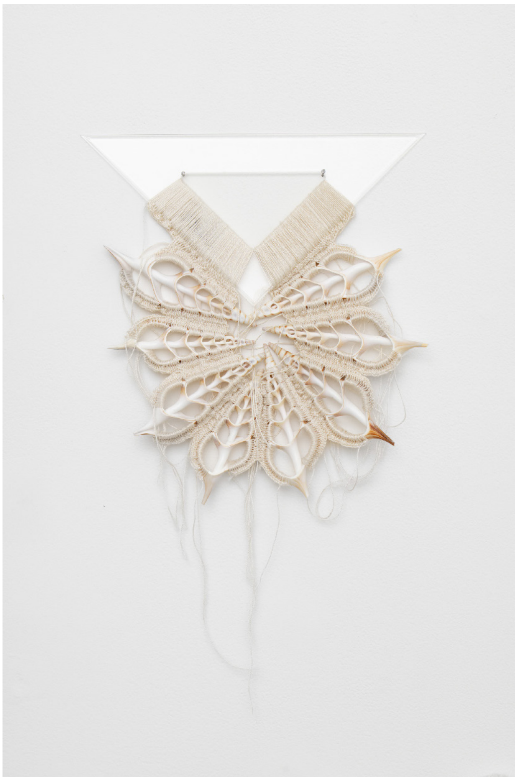
Silvana Mc Nulty, Équerre et tranches de coquillages crochetés-es blanc , 28 x 25 cm, 2023 Vue de l'exposition Déborder de ses bords , Silvana Mc Nulty, Galerie Florence Loewy, Paris Réalisée avec le soutien aux galeries / exposition du Centre national des arts plastiques.