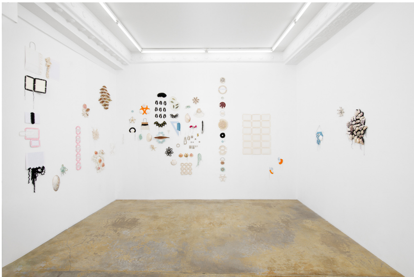
Vue de l'exposition Déborder de ses bords , Silvana Mc Nulty, Galerie Florence Loewy, Paris Réalisée avec le soutien aux galeries / exposition du Centre national des arts plastiques.