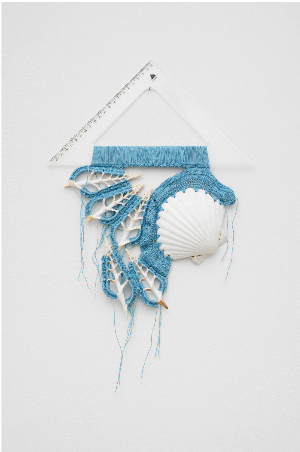
Silvana Mc Nulty, Équerre, coquillage, tranches de coquillages crochetés bleu , 38 x 30 cm, 2023 Vue de l'exposition Déborder de ses bords , Silvana Mc Nulty, Galerie Florence Loewy, Paris Réalisée avec le soutien aux galeries / exposition du Centre national des arts plastiques.