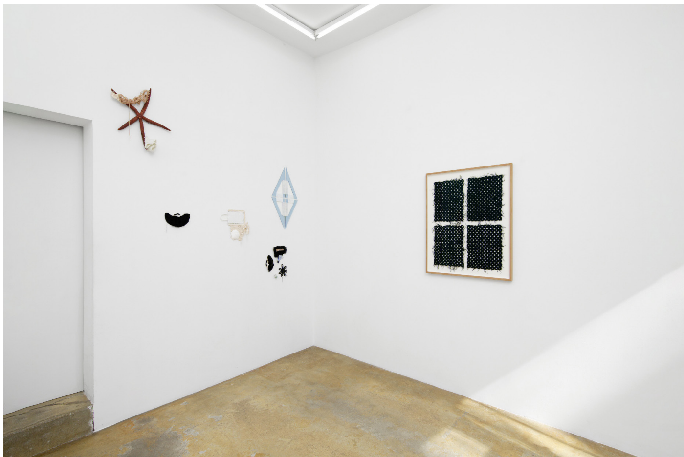
Vue de l'exposition Déborder de ses bords , Silvana Mc Nulty, Galerie Florence Loewy, Paris Réalisée avec le soutien aux galeries / exposition du Centre national des arts plastiques.