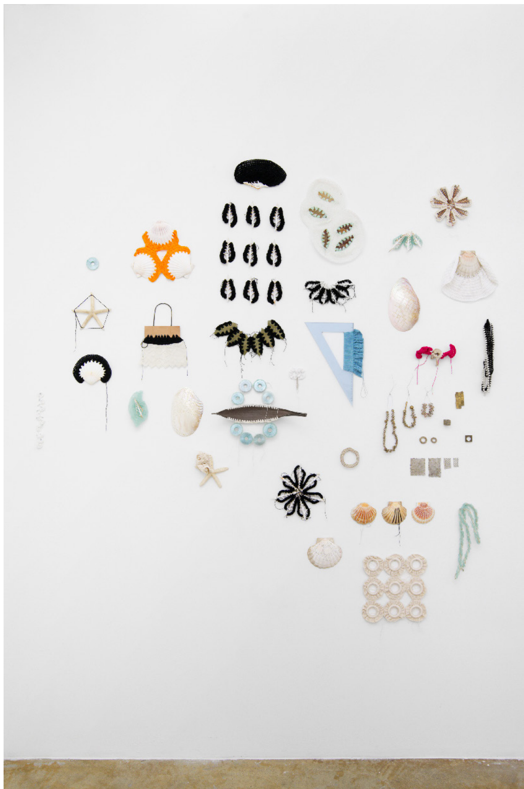
Vue de l'exposition Déborder de ses bords , Silvana Mc Nulty, Galerie Florence Loewy, Paris Réalisée avec le soutien aux galeries / exposition du Centre national des arts plastiques.