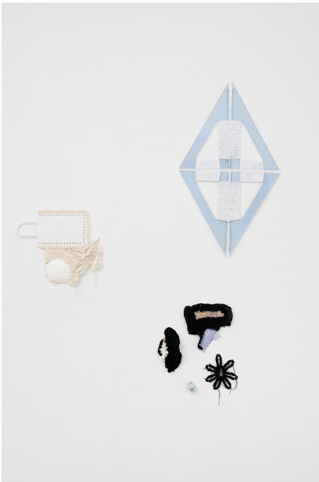
Vue de l'exposition Déborder de ses bords , Silvana Mc Nulty, Galerie Florence Loewy, Paris Réalisée avec le soutien aux galeries / exposition du Centre national des arts plastiques.