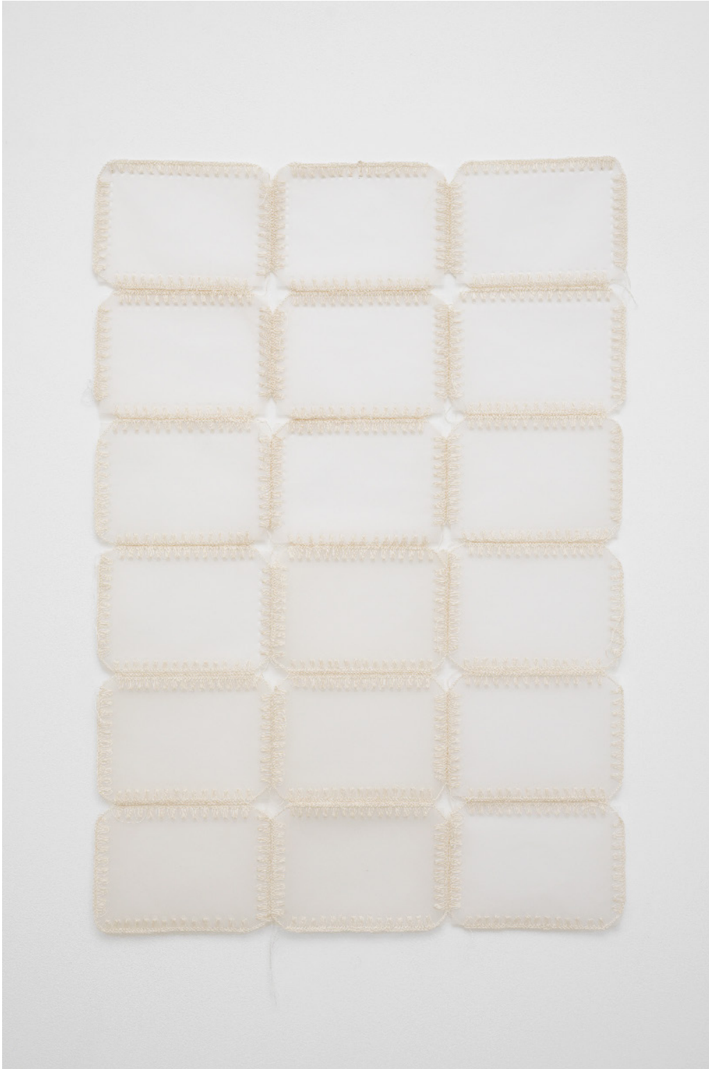
Silvana Mc Nulty, Feuilles de calque crochetées blanc , 95 x 65 cm, 2023 Vue de l'exposition Déborder de ses bords , Silvana Mc Nulty, Galerie Florence Loewy, Paris Réalisée avec le soutien aux galeries / exposition du Centre national des arts plastiques.