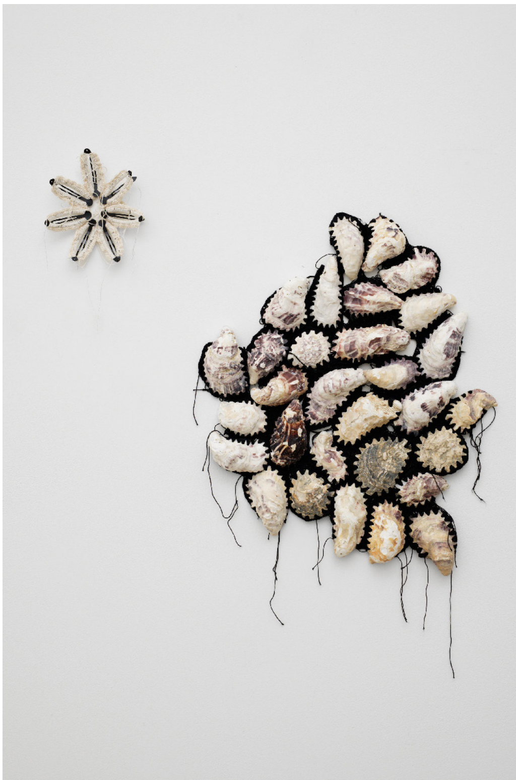
Silvana Mc Nulty, Barettes crochetées blanches , 17 x 14 cm (gauche), Huitres crochetées , 50 x 35 cm (droite), 2023 Vue de l'exposition Déborder de ses bords , Silvana Mc Nulty, Galerie Florence Loewy, Paris, 2023 Réalisée avec le soutien aux galeries / exposition du Centre national des arts plastiques.